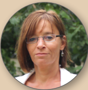
Fragen rund um das Seminarmanagement: